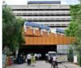
The State government has allocated ₹15 crore as an immediate measure to set up the 100-bed unit.

"The new unit to be housed within the GBA's existing multi-speciality building at Govindarajnaraga will serve residents of Vijayanagar, Rajajinagar,